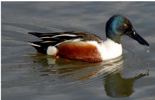
Porrón moñudo (común)